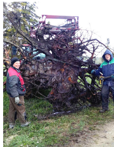
Jaanus ja Ain tegemas juurikale korralikku pesupäeva.