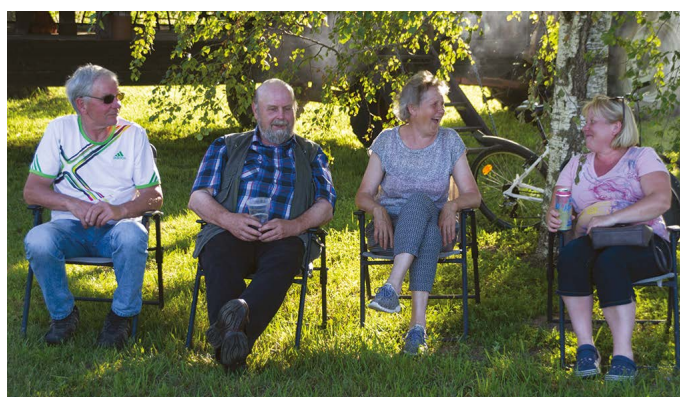
Varasemalt korrastatud kaskedealune pakkus kokkutulnutele mõnusa äraolemiskoha.