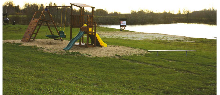
Kui vanasti said lapsed rõõmu tunda vaid veest ja liivast, siis täna on mängurõõm juba märksa mitmekesisem.