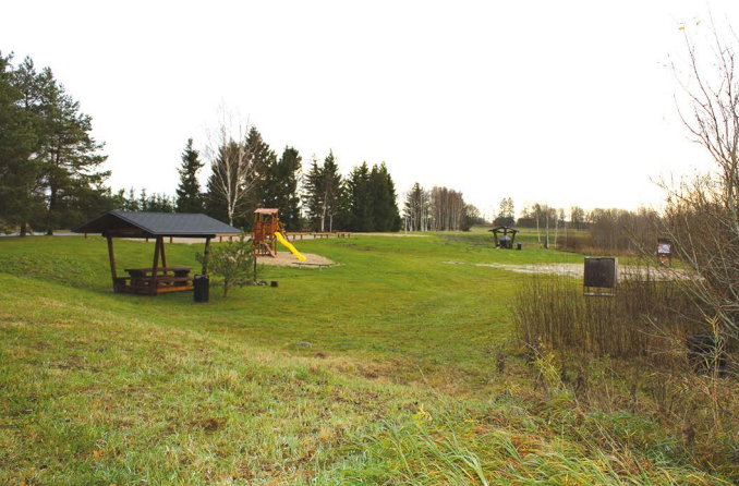
Nüüd on võimalik väikese seltskonnaga ka mõnusalt katuse all istuda ning kaasatoodud kohapeal mugavalt grillida.