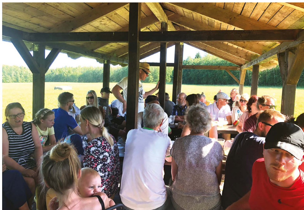
Kärusõidule tuli rohkelt rahvast ning külavanemale jäi vaid seisukoht.