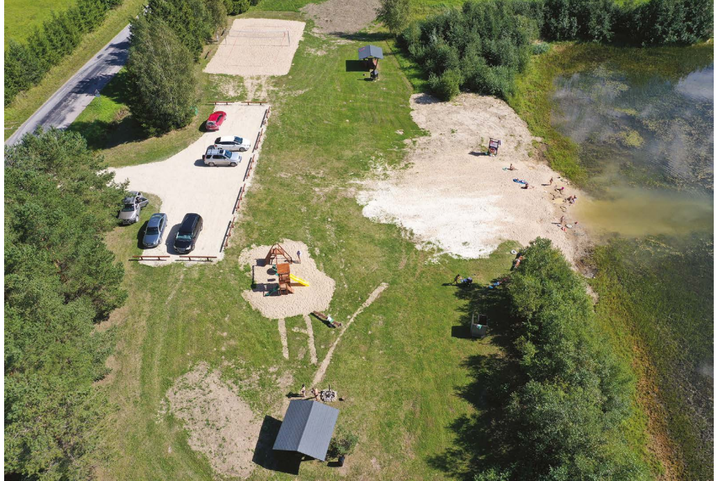
Vastrenoveeritud veehoidla äärne leidis kohe ka aktiivset kasutamist ja seda kuni talveni välja.

Hääletustulemused näitasid meile, et idee Rapla valla elanikke kõnetas ning meile anti võimalus idee realiseerida. Karitsa järve ranna poolsesse ossa puhke- ja aktiivsusala rajamine sündis koostöös Reibal JRK OÜ ja paljude teiste panusega, kes vabatahtlikuna appi tulid.