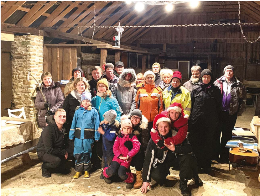
Karitsa küla "ühendkoorid" 23. detsembril 2019 Karjamõisa Viinaaidas.

Tulul tegevaks; :; Ühtlus, armastus Laulus ikka uus. :; Mis meil kallilt, kaunit Sūdant liigutab, Jumalikult hinge Üles äratav, :; Seda annab aul Vaba, lahke laul. :;